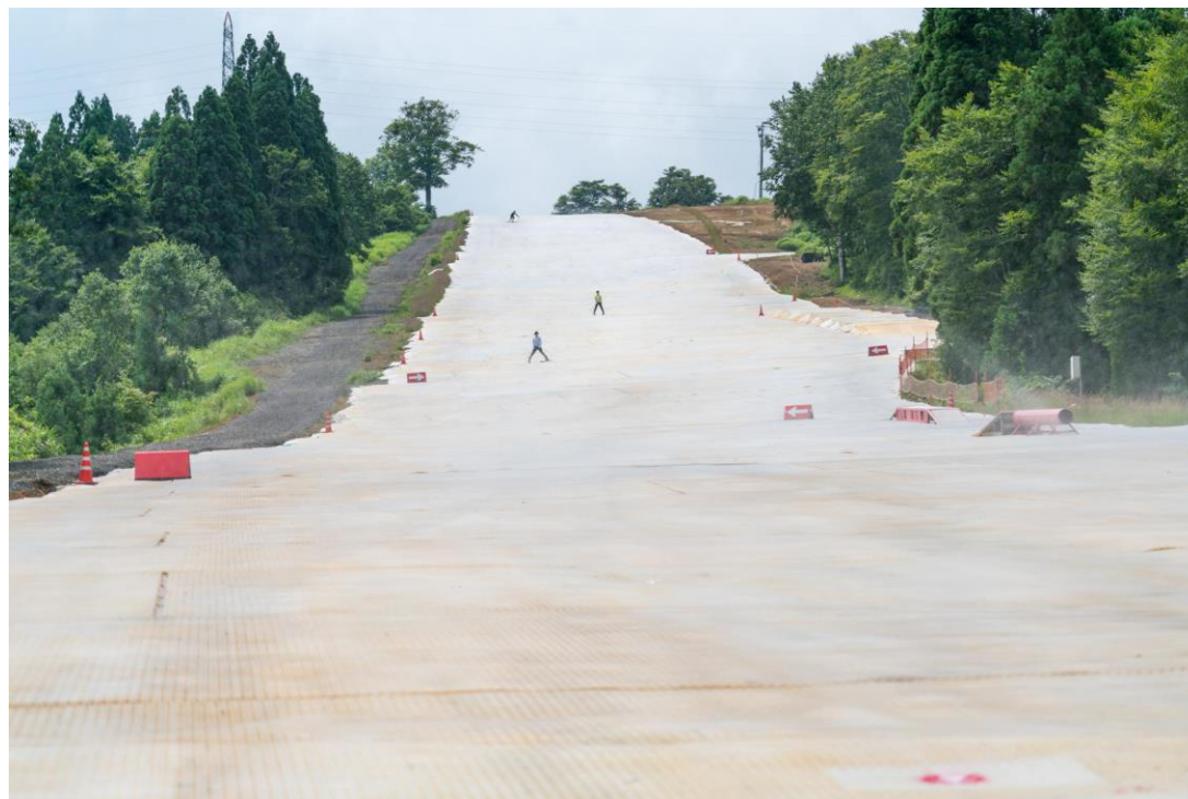
国内最大級全長1,100mスノーマットゲレンデ