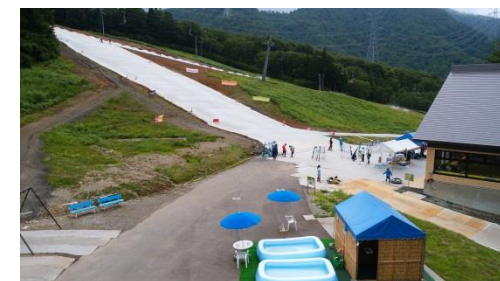
みつまたロープウェー山頂駅周辺