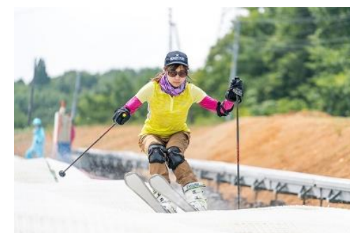
全長120m30連の人口コブ