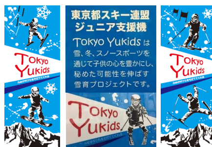
都連事務局に設置している自動販売機のデザインです。