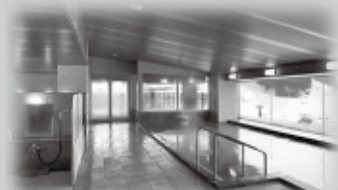
自慢の天然温泉でリフレッシュ