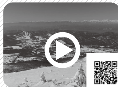
根子岳山頂からの眺望