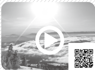
根子岳から望む雲海