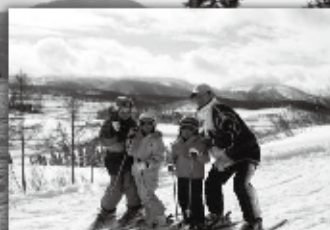
ファミリースキー