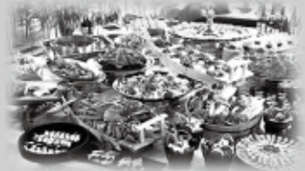
ご夕食 津南うまいものバイキング