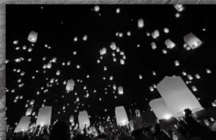
幻想の夜空・スカイランタン体験