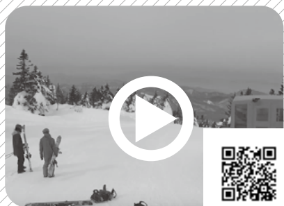
スノーキャットツアー