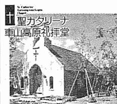
高原のチャペルで教会ウエディングはいかがですか