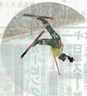
▲ストックを支点にして (アクロスキー)